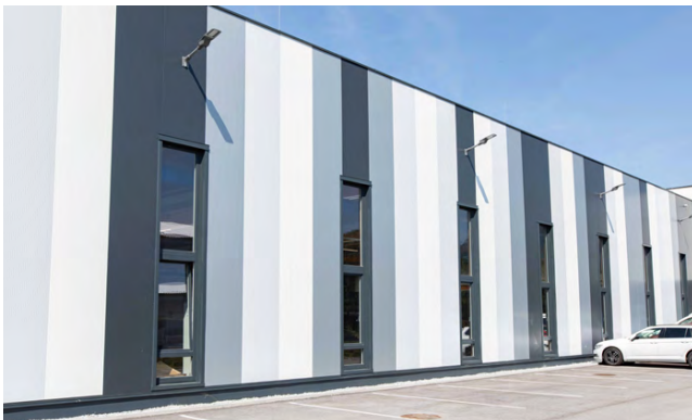
Produktionshalle | BRUCHAPaneel Fassade PIR+ & Brandschutz