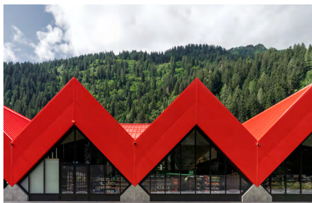
Tankstelle Gastro-shop | BRUCHAPaneel Fassade RAL 3020