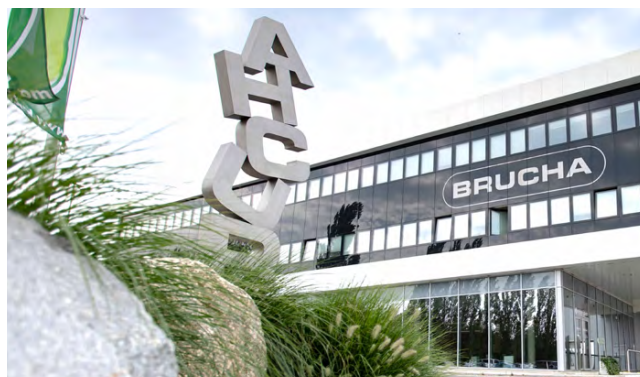
BRUCHA Zentrale/Produktion in Niederösterreich