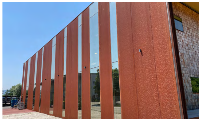
Gewerbebau | Fassadenpaneel Cortenstahl Oberfläche