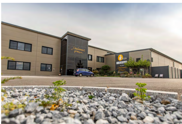
Pilzzucht | BRUCHAPaneel Fassade Premium RAL 1035