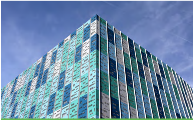
Fassade Schwimmbad | BRUCHAPaneel Carrier-System