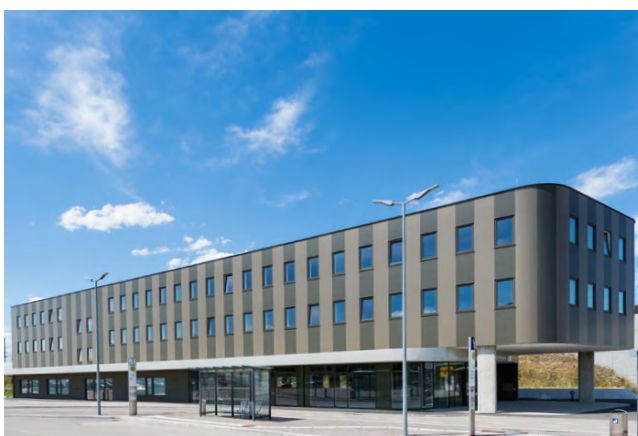
Bahnhofsgebäude | Radius-Fassadenpaneel vertikal