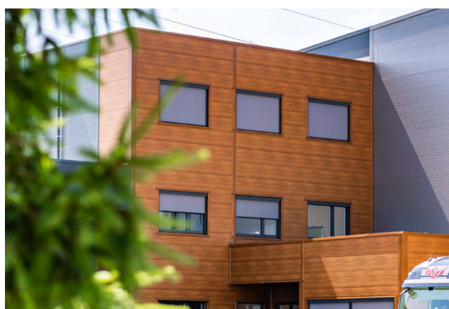
Papierfabrik | Fassade Premium in Holzoptik & RAL 9006