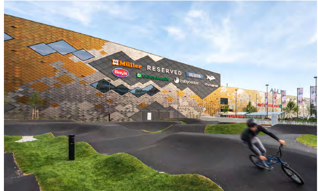
Shopping Center | BRUCHAPaneel Carrier-System